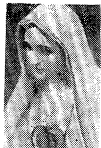
"El Maestro está aquí y te llama"