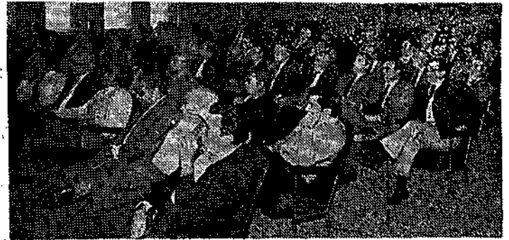
Una vista del salón de actos de la Cámara de Comercio