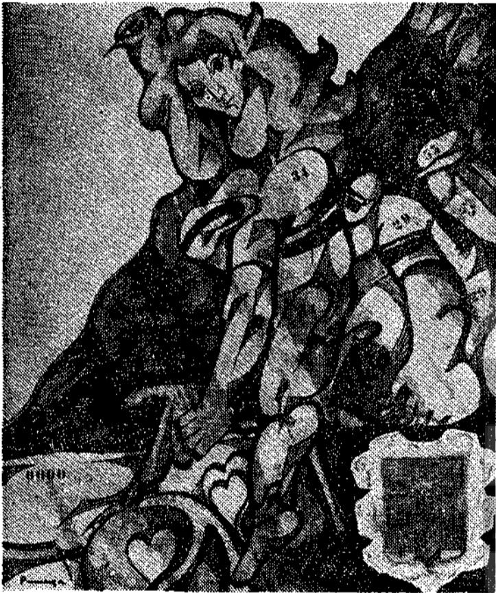
Este es el cartel anunciador de los Campeonatos de España de profesionales. El pintor murciano Párraga ha sido el artífice de esta obra. Con la firma de este hombre en el cartel se convierte a la vez éste en una obra de arte