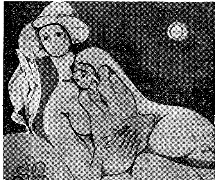
Una de las obras de Parraga.

«NO TENEMOS ESCUELA DE PINTURA PORQUE HACEMOS LA GUERRA POR NUESTRA CUENTA»