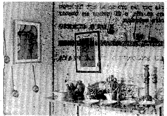
Muestra de pintura, cerámica y antigüedades. (Foto TOMAS).

OTRAS MUESTRAS: PINTURA, ANTIQUEDADES, CERAMICA, PAJAROS Y PLANTAS