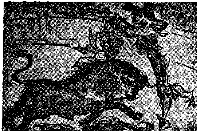
Pedro Flores (Exposición "Obra Gráfica")

ricular de las cosas tras un proceso de interpretaciones personales. Es decir, no reproducir los objetos como son, sino como el pintor quiere que sean para que quede constancia de su participación artística. Y, en tal sentido, el tema pictórico debidamente valorado no es un fin del cuadro, sino el comienzo del mismo. El tema pictórico es la idea cimentadora de la labor plástica, el presupuesto indispensable para la creación artística, la cual es incompatible, en su recto sentido, con todo trabajo de mero trasunto. Así se explica que en los cuadros de Jean-Claude Bertrand haya servido la Naturaleza para crear el propio paisaje del artista, como una traducción libre de los lugares recordados. A lo cual se presta la Naturaleza de un modo especialmente favorable, porque el paisaje es el menos exigente de los modelos y el que, por ello mismo, permite al pintor un mayor lucimiento imaginativo. Utilizando este concepto, la materia cromática desempeña en los cuadros de Bertrand una función delimitadora de estructuras mediante el contraste acordado de empastes generosos, cuyos colores se convierten, convenientemente situados, en elementos sugeridores de formas naturales. La Naturaleza así descrita gana en misteriosa apariencia y en valor pictórico cuanto pierde en exactitud refe-