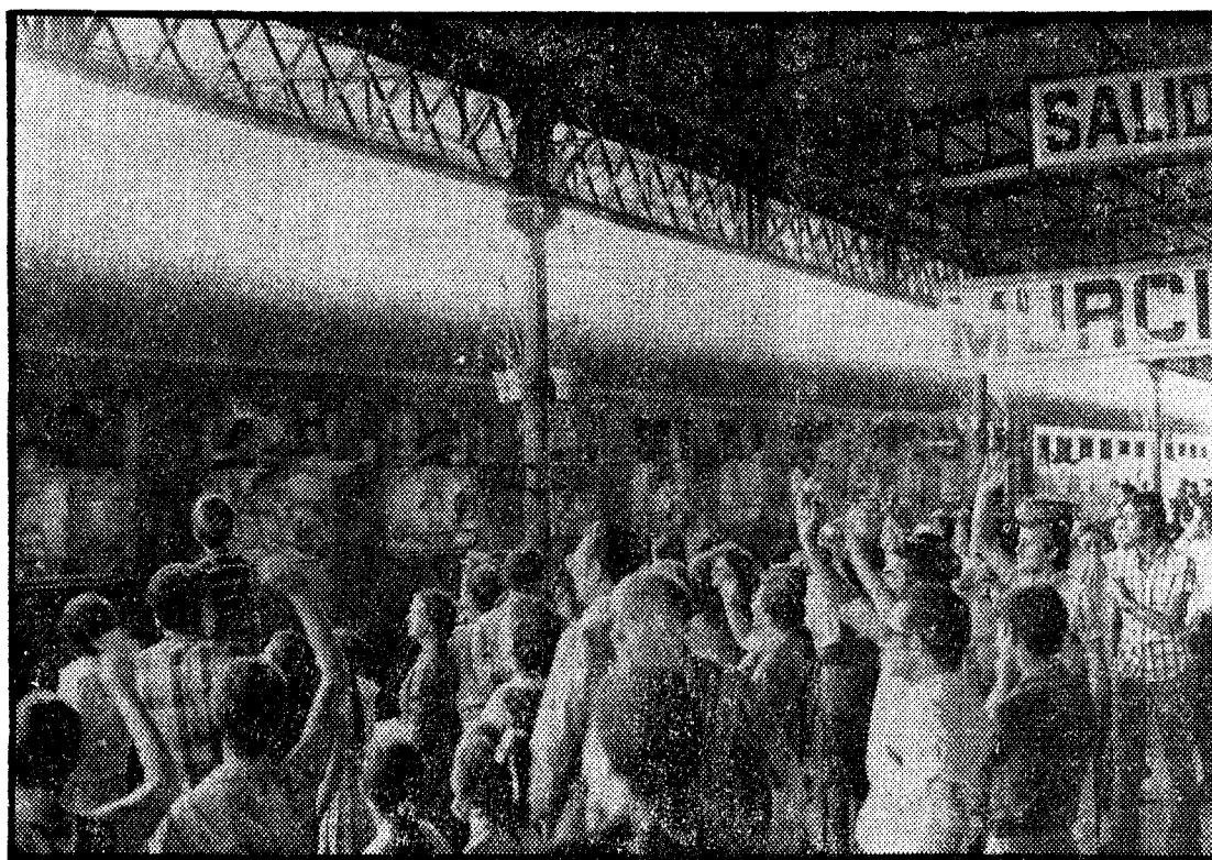
Los familiares reciben a los peregrinos.

La quinta peregrinación diocesana a Lourdes puede ser considerada como una gran manifestación de fe y devoción a la Virgen María, y significa un notable desarrollo del espíritu religioso que alienta la Hospitalidad Murciana de Nuestra Señora de Lourdes. J. H.