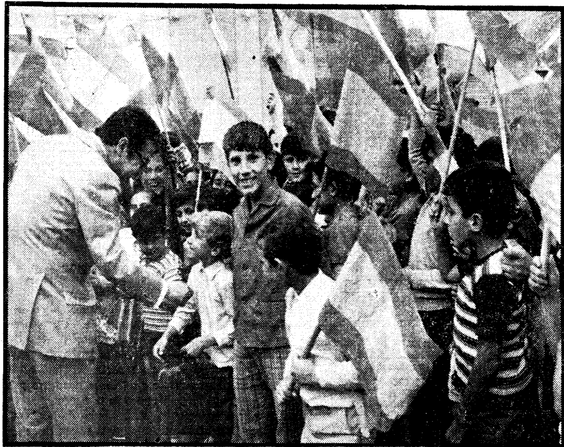
Los niños recibieron con banderas al alcalde.