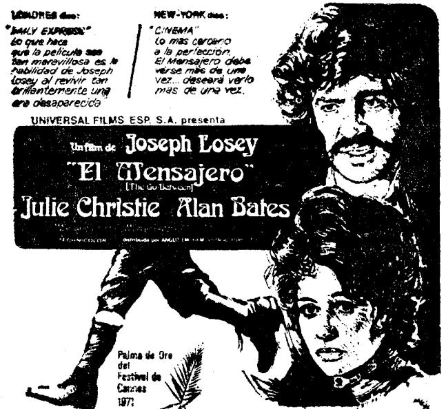
Un muchacho apresado en la intrincada red del juego amoroso secreto de dos adultos. (Mayores 18 años)

Estreno extraordinario de la película que obtuvo sin discusión la palma de oro, en el Festival de Cannes. Una película que reúne los más altos valores humanos, espectaculares, artísticos y técnicos.