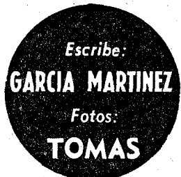
Escribe: GARCIA MARTINEZ

Dicho lo anterior, algunos pensarán que varios miles de murcianos se sentaron en las gradas del estadio de Ceuta. La verdad es que sólo acudieron veinticinco aficionados de Murcia, lo cual no quiere decir que no fuesen justo el diez por ciento del total de espectadores, ya que no había más de doscientos cincuenta.