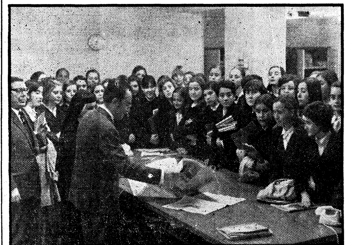
Ayer tarde visitaron nuestro periódico las alumnas de cuarto curso de bachillerato del colegio de las HH. Carmelitas. Tras recibir una somera explicación de lo que es y cómo se hace un periódico, recorrieron la redacción, salas de teletipos y télex, telefoto, talleres y fotograbado. En la foto, un momento de su visita, precisamente en la redacción.