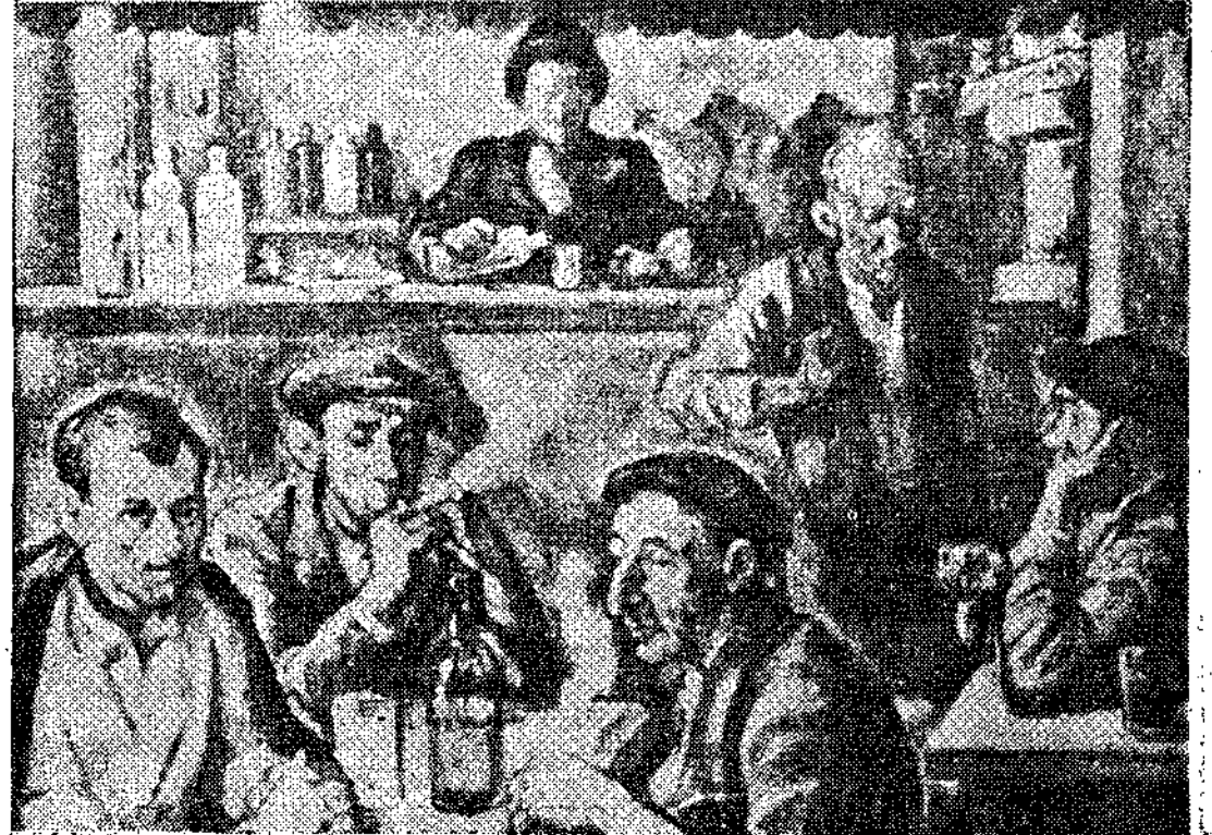
"La taberna", óleo de Garay que figuró en su exposición celebrada en la Caja del Sureste