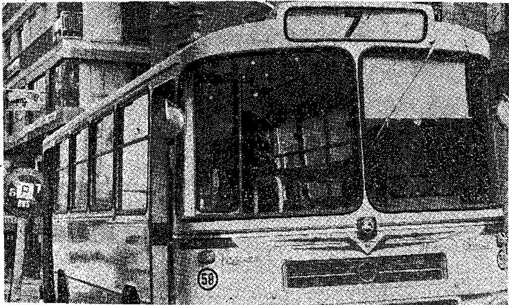
Ayer se inauguró, como anunciábamos, la línea 7 de los autobuses urbanos, con recorrido inverso a la número 3. El conductor asumió también aquí las funciones de cobrador