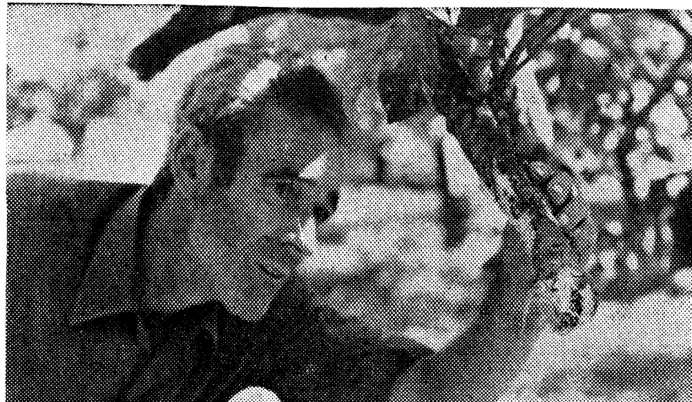
"Así deja el "Gorila" las ramas de los limoneros" —explica nuestro acompañante

Si a la tradicional afición de las gentes por las fábulas, le echamos de comer con un suceso más o menos insólito,