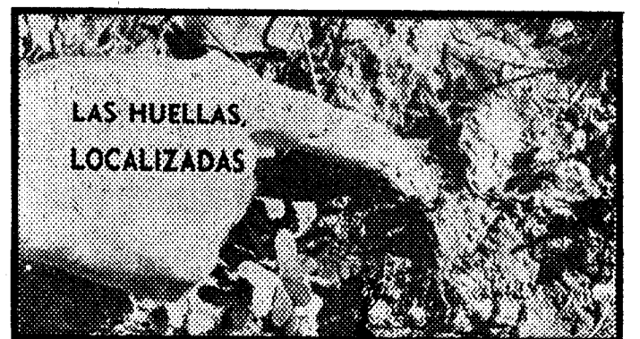
LAS HUELLAS LOCALIZADAS

los vecinos de ambas localidades, así como quienes viven a orillas de la carretera que las une, andan miedosos y lle-