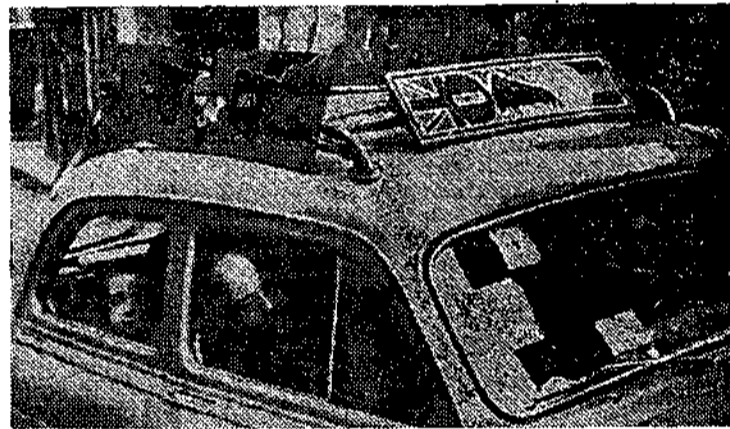
El señor Cardo Esquer y sus pancartas.