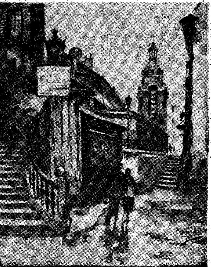
"PAISAJE", DE GARHDEZ