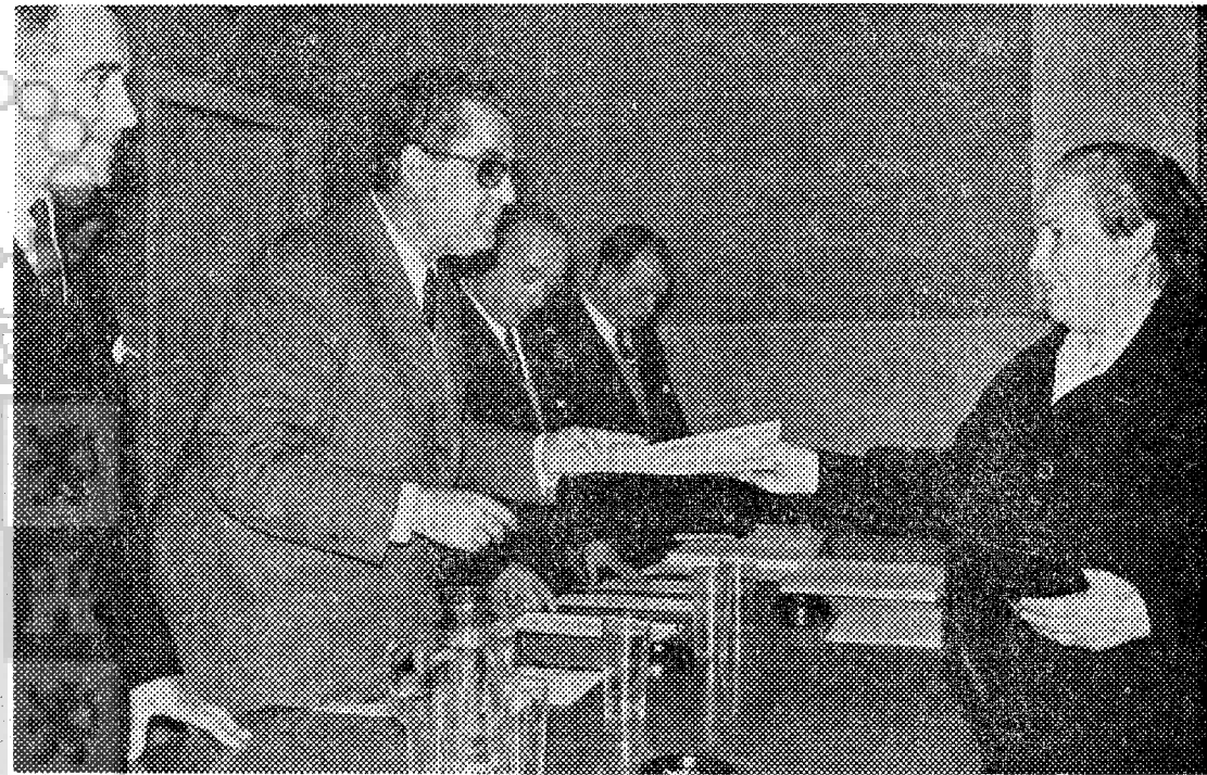
Un momento de la entrega de viviendas.