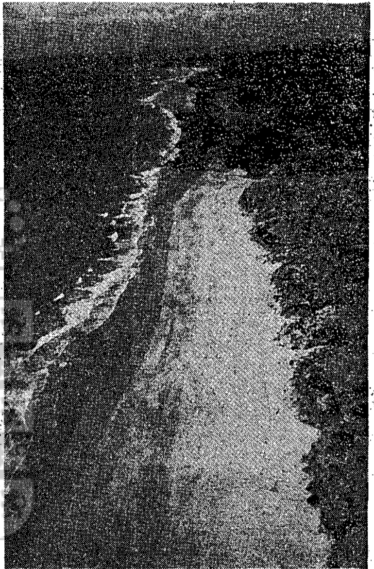
Hasta El Mojón, playas casi vírgenes están esperando la presencia de gentes que las rediman del olvido.

¿Qué fueron de aquellos ambiciosos planes de reivindicación