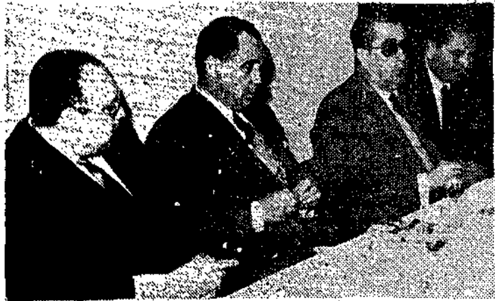
Presidencia del acto ayer en "COMURSA"