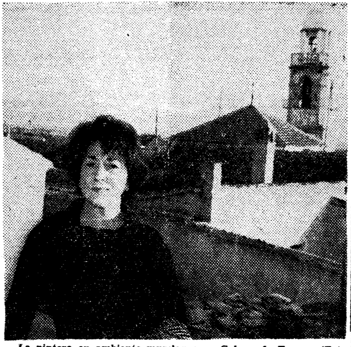
La pintora en ambiente murciano: en Cabez de Torres.

"Veo que mi pintura ha tenido ambiente en Murcia; por eso esperaré más el premio"