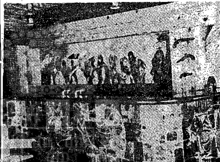
Así están decoradas las paredes del "snack-bar" de Cabo Roig, merced a la labor creadora de los artistas murcianos.