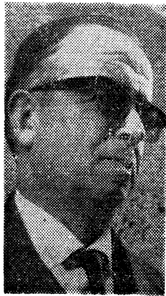
DUENO DE BAR

Como puede verse, hay opiniones para todos los gustos. Ello nos viene a demostrar que los festejos son auténticamente populares, ya que la polémica alcanza, en determinados momentos, un tono más bien ra-