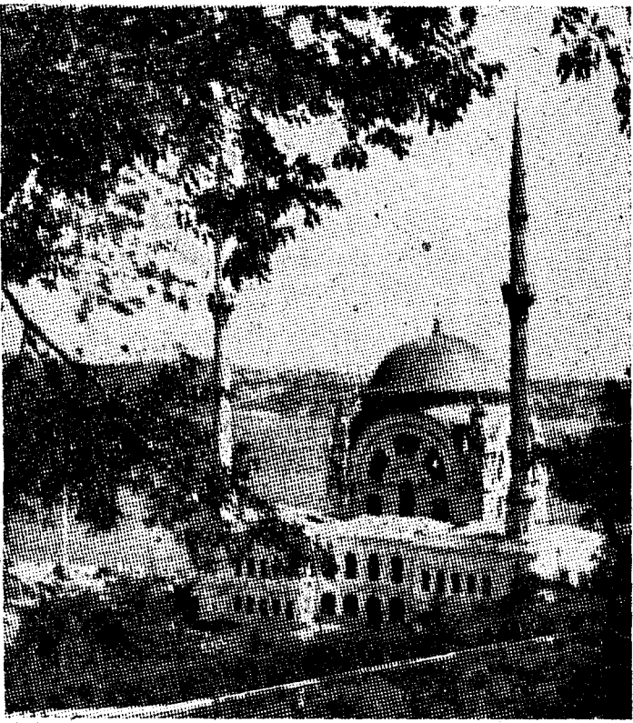
El perfil de la mezquita, con sus minaretes como agujas, luce en el esplendor de Estambul con fulgores propios

Vista de noche, Estambul es algo así como el sueño de cien poetas, que hubieran sumado sus fantasías respectivas a fin de imaginar lo más soberanamente hermoso.