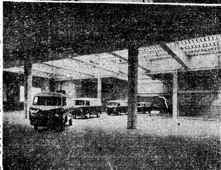
Grupo de coches construídos por "Fadisa", dispuestos para su distribución y entrega

Solicite información sobre características técnicas y ventas a sus agentes exclusivos de ventas para las provincias de ALICANTE, MURCIA y ALBACETE COMERCIAL ALICANTINA, S. A. (Comalsa) ALICANTE: Italia, núm. 3 - MURCIA: Rambla, núm. 24 - ALBACETE: Juan Sebastián Eiccano, núm. 43